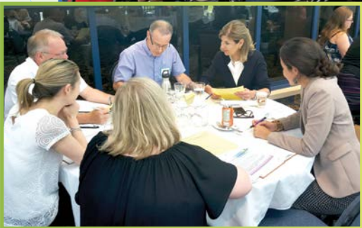
Des groupes de discussion avec nos partenaires du vaste secteur ont aidé à façonner le rapport Ensemble dans Peel.