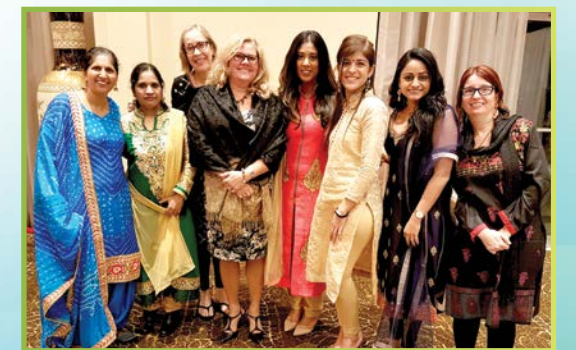
Le personnel a assist  au Gala de la Journ e internationale de la femme de l'organisation Punjabi Community Health Services.