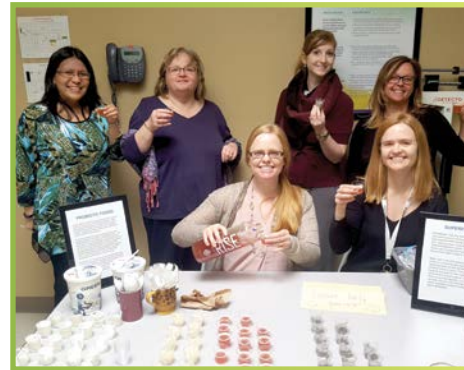
Un «  chantillonneur de super-aliments »  tait parmi les activit s organis es par le Comit  de la sant  et du mieux- tre pour le personnel.

Notre programme de sant  et de bien- tre organisationnel men  par notre personnel a  t  reconnu   l' chelle nationale par GoodLife Fitness en automne 2016. Le PCC, en partenariat avec notre organisme s ur NYS, est fier d'avoir  t  l'une des six organisations   recevoir le prix GoodLife Health & Wellness Leadership. Ce prix est d cern  aux organisations qui d montrent des am liorations continues dans les domaines connexes   la sant  physique, l'activit , la nutrition, l'enseignement et les changements comportementaux chez leurs employ s. Le prix c l bre les initiatives des organisations, quels que soient leur taille ou leur secteur d'activit , visant   donner l'exemple afin que d'autres organisations puissent elles aussi apprendre et int grer des pratiques innovantes, avec pour r sultat une population canadienne en meilleure sant  et plus productive. Merci et f licitations   notre personnel pour avoir fait de la sant  et du bien- tre une priorit  chez le PCC/NYS, afin que nous puissions continuer   fournir des services de haute qualit  aux enfants, aux jeunes et aux familles que nous desservons.