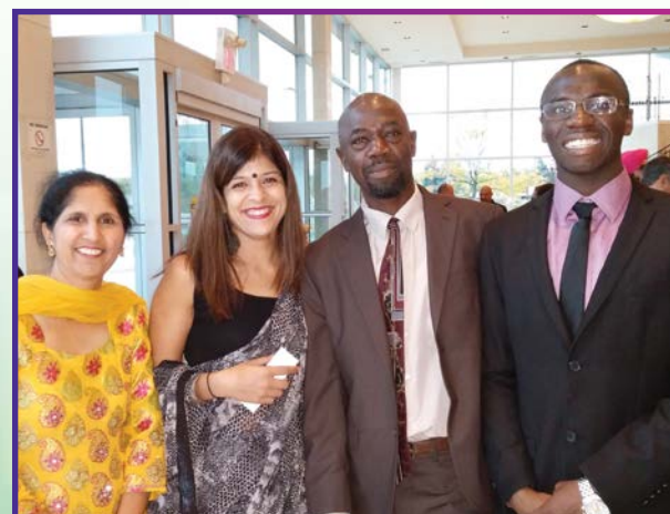
Gala Centraide 2015 à l'appui de la communauté noire et du leadership dans cette communauté