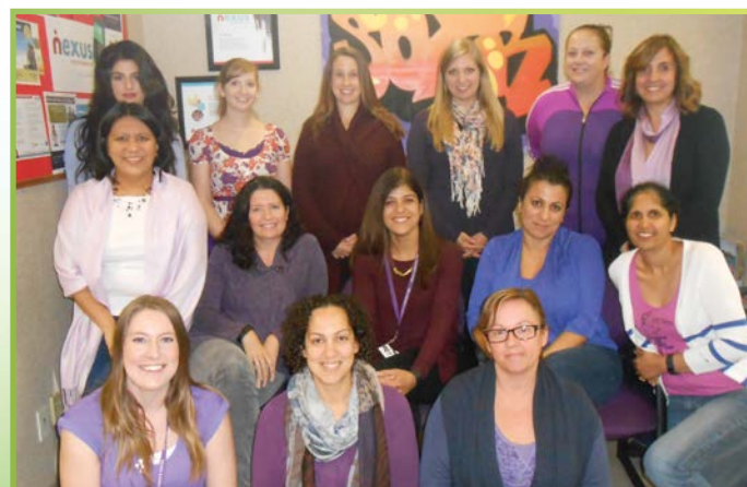
Membres du personnel du PCC vêtus de pourpre pour le Mois de la sensibilisation à la violence contre les enfants et la prévention