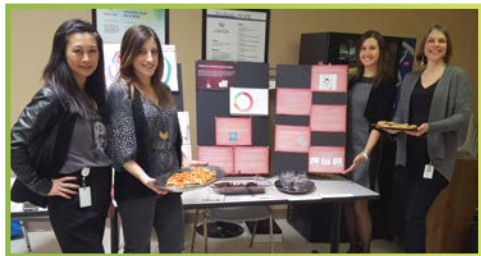
Mois de la psychologie

Le Plan de prestation des services essentiels a identifié comme priorités l'élaboration et la mise en œuvre d'un mécanisme à l'échelle du système visant la mobilisation des jeunes et des familles. Avec l'appui du Centre d'excellence en santé mentale des enfants et des adolescents, le PCC a continué de travailler avec nos partenaires PSE et de façon plus élargie avec nos partenaires sectoriels pour acquérir des connaissances sur les meilleures pratiques de mobilisation des jeunes et des familles dans le secteur SMEJ et les secteurs partenaires, à l'échelle locale, provinciale et nationale. Le PCC a hâte de travailler avec nos partenaires PSE pour soutenir l'évolution des mesures de mobilisation des jeunes et des familles à titre de pratiques exemplaires pour la prestation des services de santé mentale aux enfants et aux jeunes dans Peel.