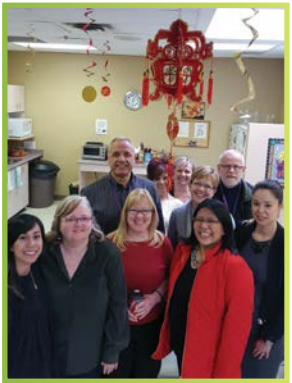
Célébration du Nouvel an chinois

À l'externe, les points saillants ont compris :