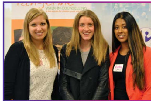
Conférence des jeunes leaders de Peel 2015